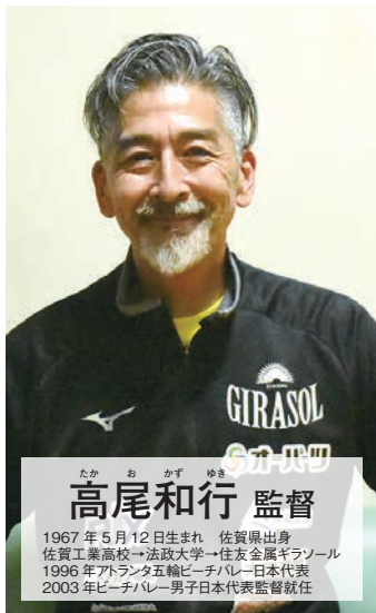
たか お かず ゆき 高尾和行 監督 1967年5月12日生まれ 佐賀県出身 佐賀工業高校→法政大学→住友金属ギラソール 1996年Vリーグ五輪→チバレー日本代表 2003年ビーチバレー男子日本代表監督就任